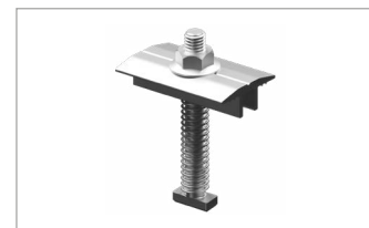
Middle Clamp novotegra