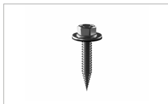
Self Tapping Screws