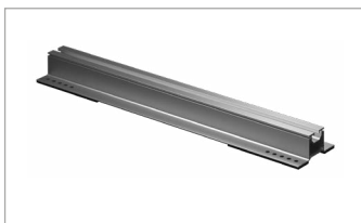
NT Rail novotegra